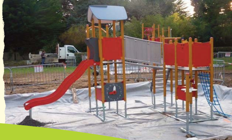
Aire de jeux de Kerbourgneq