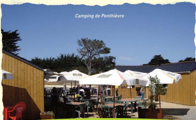
Camping de Penthièvre

L'an dernier, Monsieur le Préfet, au regard de la loi, nous a retiré notre appellation de commune touristique, car nous n'avions pas