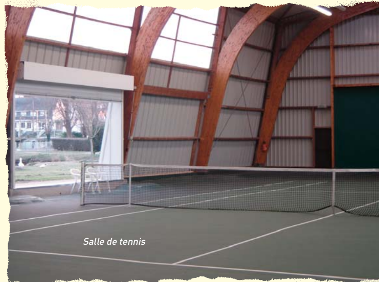
Salle de tennis

très peu des travaux prévus ont pu être réalisés, en raison de problèmes sur