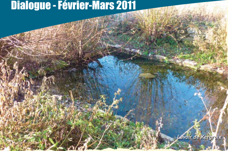
Lavoir de Kergroix

les réseaux en sous-sol et qui sont pris en charge par le syndicat de région ABQP (Auray, Belz, Quiberon, Pluvigner).